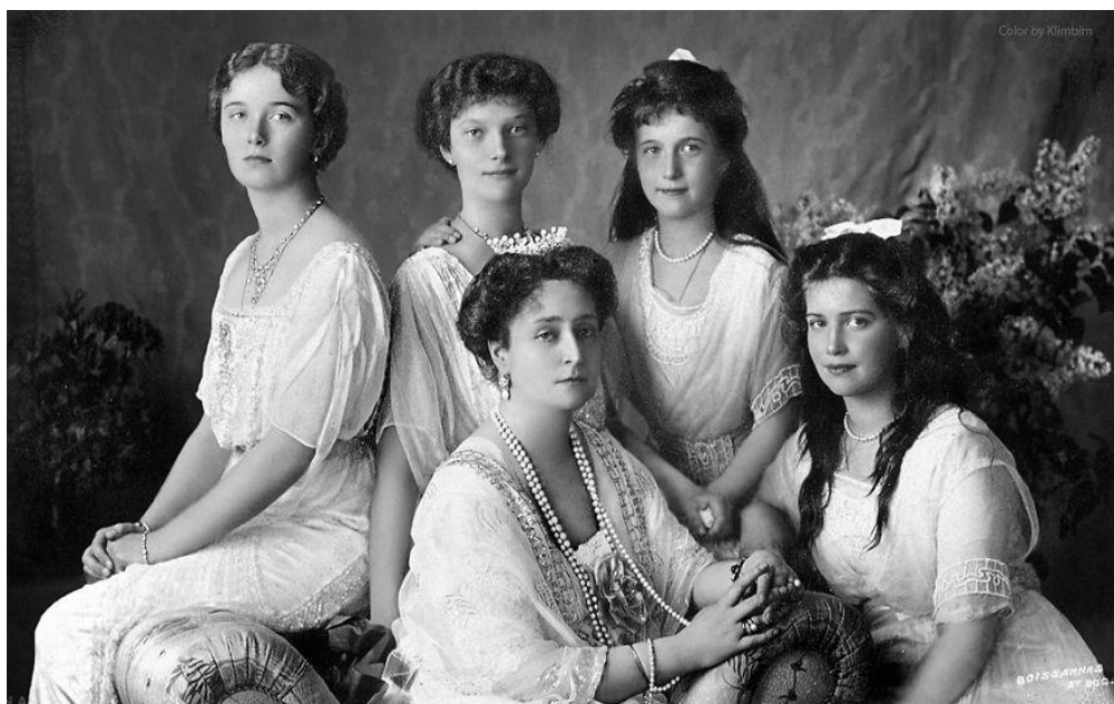
Императрица Александра и её дочери: Ольга, Татьяна, Мария, Анастасия

Дорогие женщины, вы никогда не задумывались почему практически каждой из нас так тяжело быть постоянно с детьми? Почему нас куда-то тянет из дома? Почему ради выхода в свет, мы