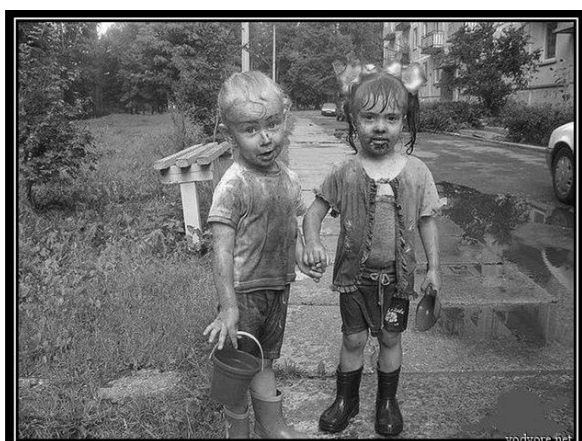
Самое правильное детство

Еще немаловажный аспект темы. Каких-то 15 лет назад дети массово наблюдали повседневную жизнь родителей: работу, занятия домашним хозяйством, даже в магазин детей брали чаще. Я сужу об этом на основании детских рисунков. В 1994 году диагностический рисунок «Семья» изображал обычно или «мама на кухне, папа на диване перед телевизором, я в своей комнате катаю машинки», или «мама, папа, я, взявшись за руки гуляем по улице». Сегодня рисунки детей показывают, что даже у кошки есть свой айпад. Все сидят, уткнувшись в мониторы. Безрадостная картина, как сказал ослик Иа-Иа.