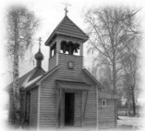
Приход Всех Святых с.Чажемто