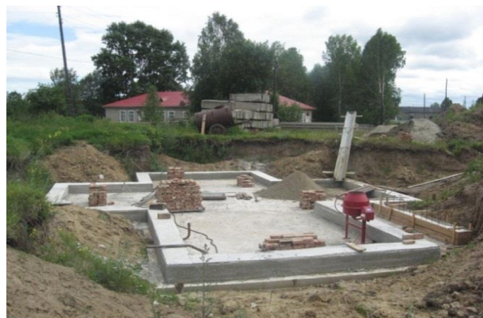
Июнь 2011 год