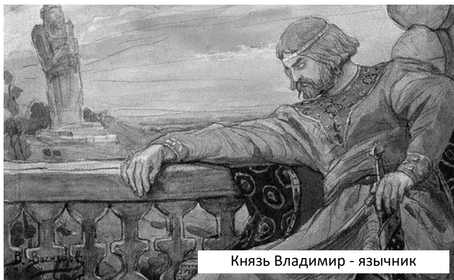
Князь Владимир - язычник

"Каждый православный народ особенно чтит первого из своих князей и царей, который дал своей стране Христа". Митрополит Антоний Сурожский