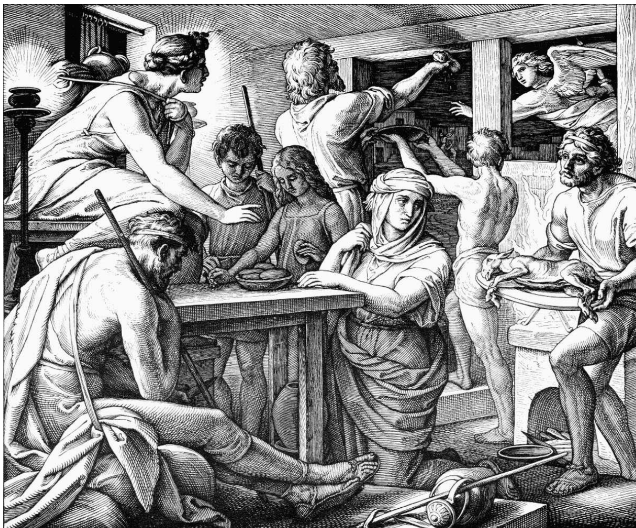
Еврейская пасха в Египте.

Потому что большинство людей не знают, что там предлагается, а чаще и не хотят знать . Все помыслы о земном. Так животные живут и не думают, что их ожидает. Кормят хорошо, они и довольны. Это жизнь плоти, в которой нет духа. Человек же существо духовное.